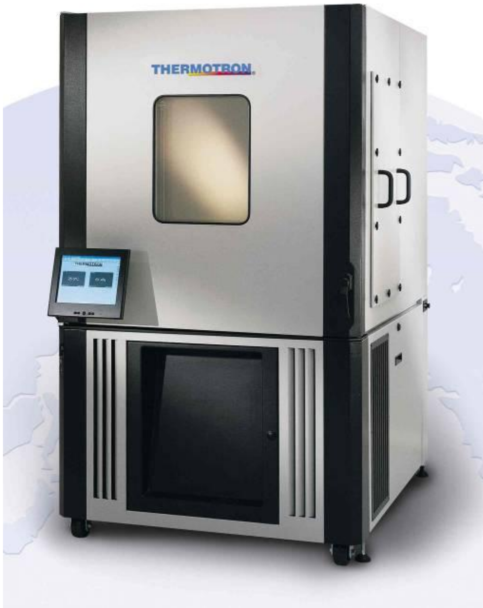
Камера Модель SE-600-3-3 (производство США)

Климатическая камера повышенного качества для военных производств